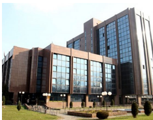
15 судски постапки завршиле во полза на новинарите

Анализа на судските случаи во кои новинар или медиумски работник го бранел своето работно право со помош на ССНМ покажува дека иако е тешка и пред се нерамноправна, таа битка се исплаќа.