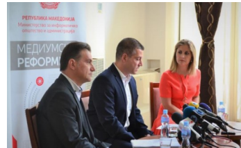
Дебата за реформи во медиумите