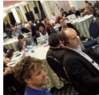
Конгрес на Европска федерација на новинари во Букурешт