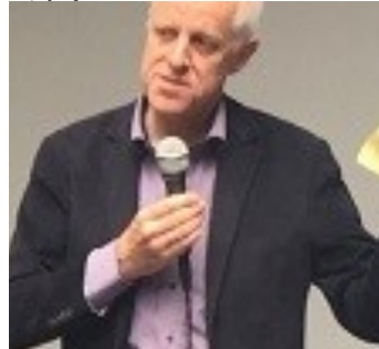
Могенс Блишер Бјерегард е Претседател на Европската федерација на новинари (ЕФЈ)