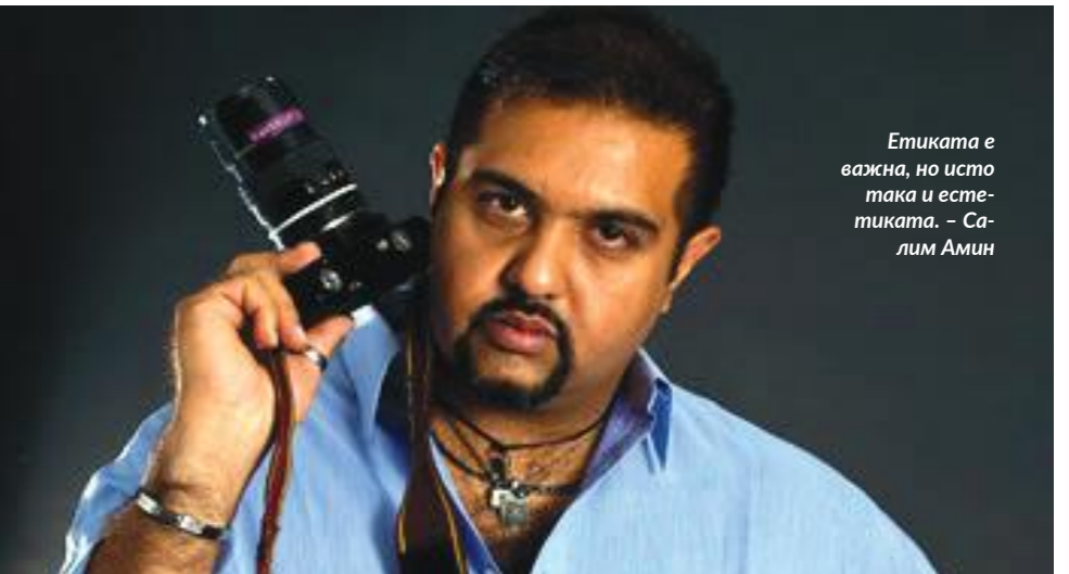
Етиката е важна, но исто така и естетиката. - Салим Амин

шоп и за дигитално подобрување на фотографиите, отколку што учат како всушност да направаат добри фотографии. Во суштина, тие се учат како да „измамат“ во училищата, што е сосема спротивно на секое фундаментално правило кое што сум го учел како фотограф уште од детството! Колку е важно како фотографот пристигнува до финалната фотографија? Слушнав дека многу фотографии се етикетирани како „измамници“ заради либералната употреба на фотошоп за да се заврши фотографијата. За оние кои гледаат на тој начин, претпоставувам дека прекумерната употреба на фотошоп, ја поништува работата во создавањето на вистинска фотографија и ја пренесува во некоја друга форма на уметност. Но, колкав е соодносот на манипулирање и подобрување на фотографиите. Етиката е важна, но исто така и естетиката. И да не забораваме дека се што создаваме како фотографии, како артисти, е толкување на она што го гледаме околу нас. Изборот на камерата, нагодувањата, составот; ние постојано се наметнуваме на еден или на друг начин врз „реалноста“. Во таа смисла, нема апсолутна вистина. Но, манипулацијата на сликите за да се смени смислата, контекстот и претставата