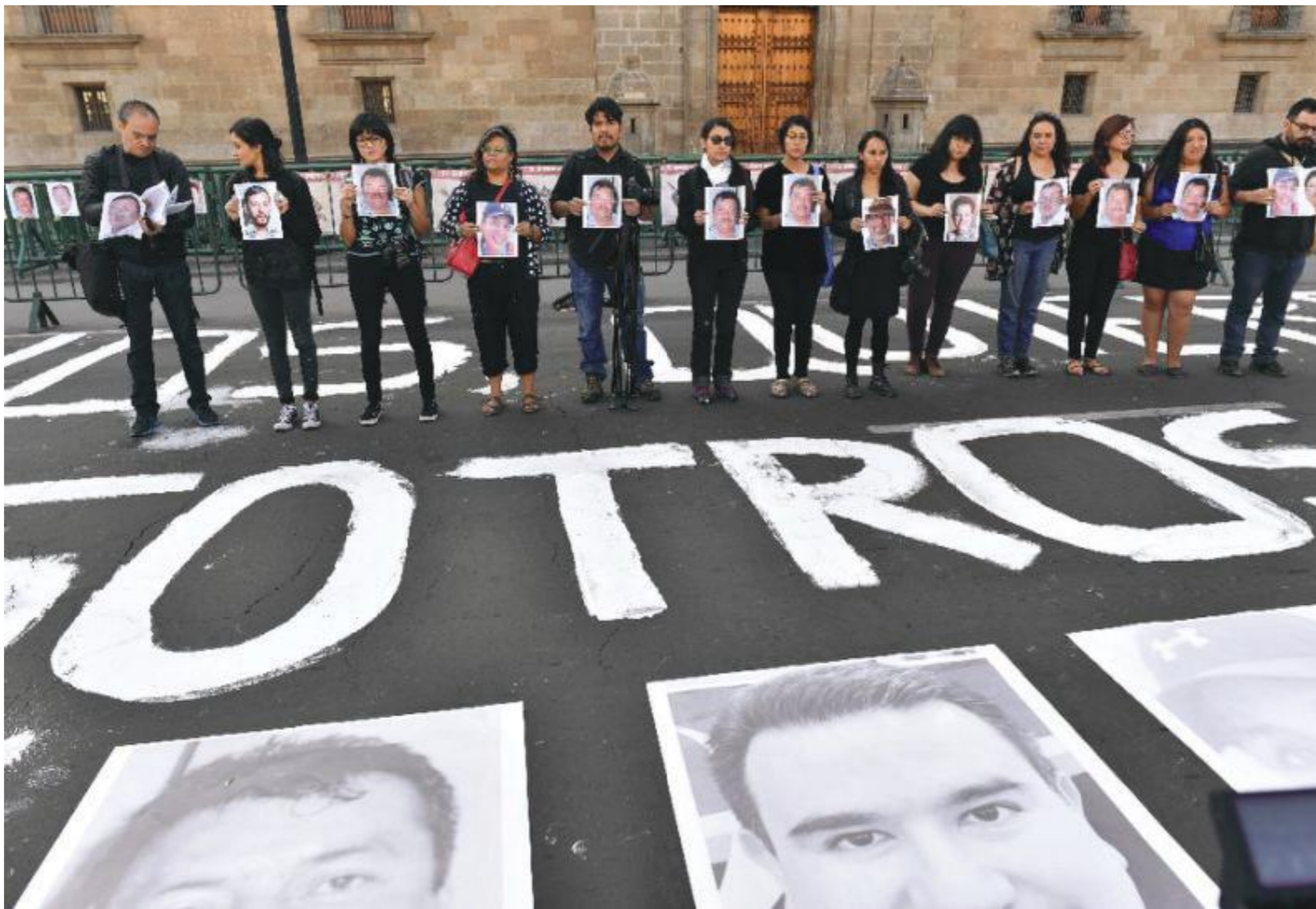
Претставници на медиумите ги држат сликите на своите исчезнати и убиени колеги за време на протестот против убиствата на новинари и фоторепортери пред Националната палата во Мексико сити

„Контекстот [во Мексико] е едно од сериозните прекршувања на човековите права, преку кои јавните сили на правото и редот, од општинско до државно ниво, ја наметнуваат безбедноста преку злоупотреби и употреба на насилство како начин за контролирање на териториите