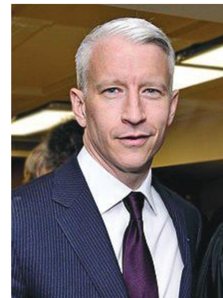
Андерсон Купер од Си-Ен-Ен водеше национална дискусија околу самоубиството

Андерсон Купер од Си-Ен-Ен водеше национална дискусија околу самоубиството. Познатиот новинар, дописник и автор Себасијан Јунгер отворено зборуваше за неговото пост-трауматско стресно рас-