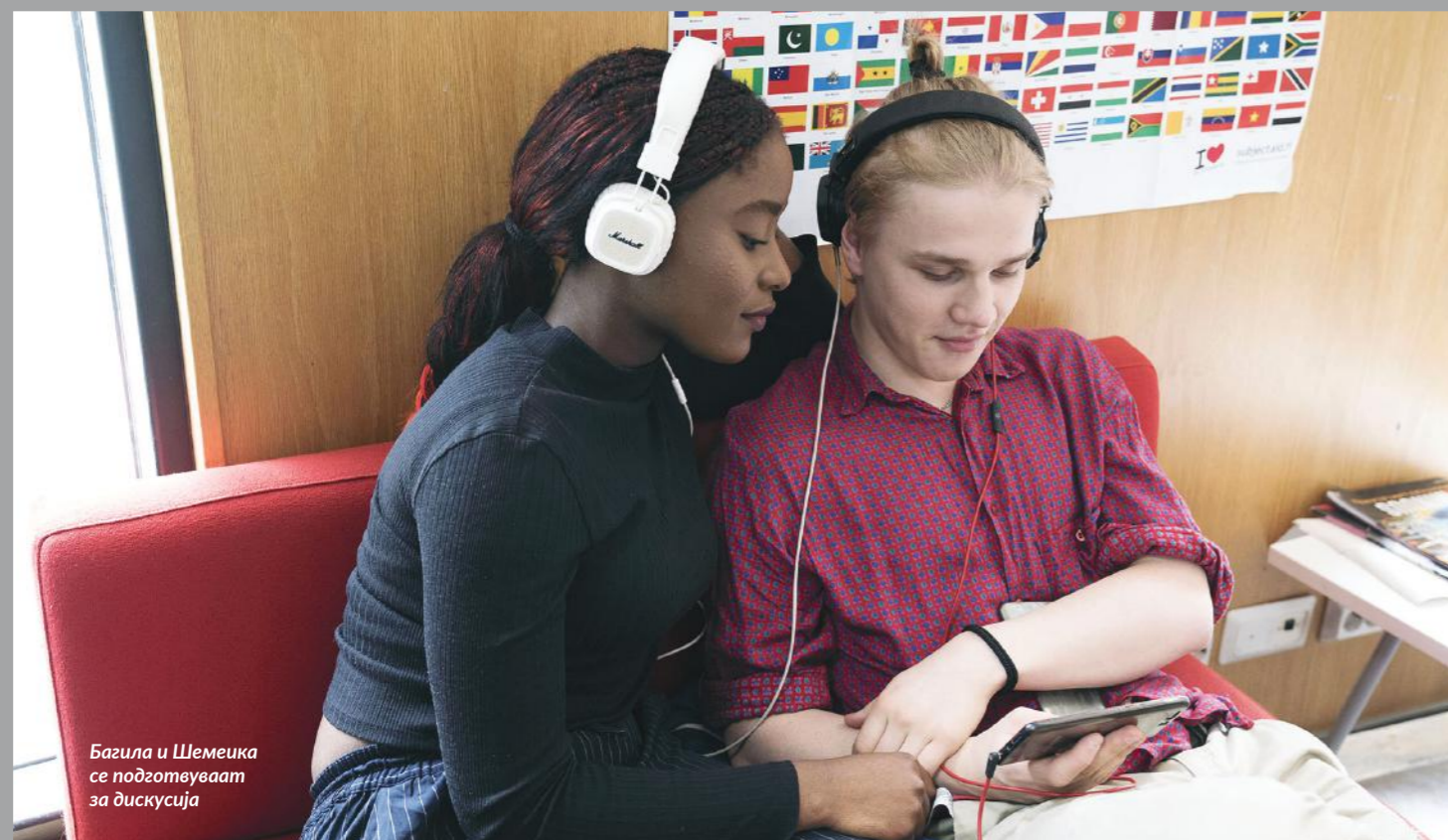
Багила и Шемеика се подготвуваат за дискусија

„Финците имаат многу уникатна и специјална доблест, а тоа